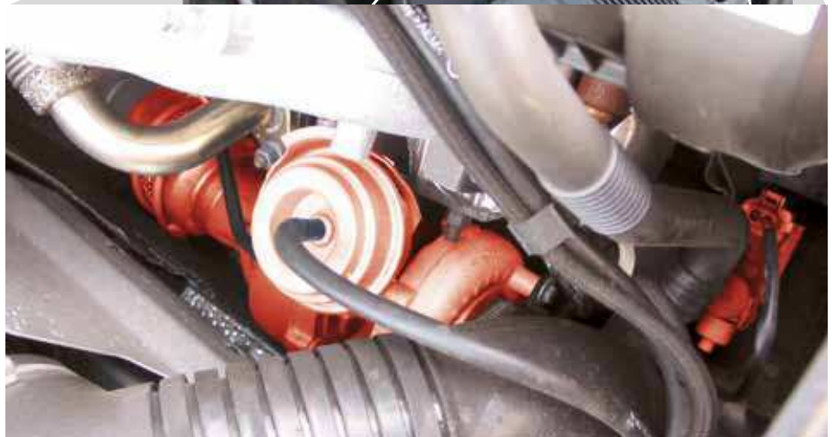
EPW et compresseur VTG (signalé en rouge) dans une Audi A4 TDI