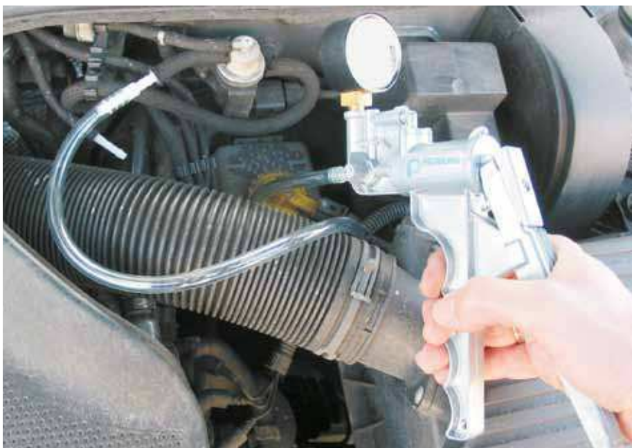
Contrôle d'une EPW avec la pompe à dépression manuelle (VW Golf IV)

C'est pourquoi il est recommandé ici de faire appel à un spécialiste possédant des connaissances de système et qui ne se