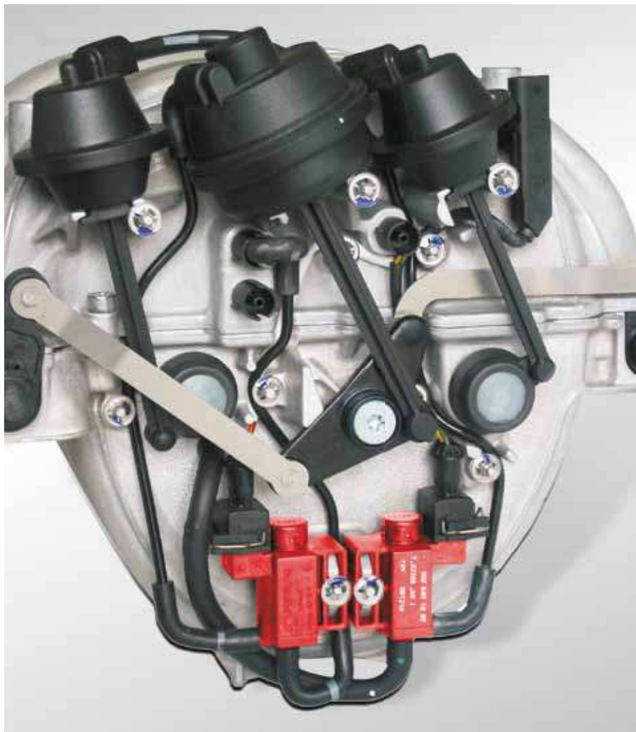
Exemple d'application : tubulure d'aspiration à résonance avec soupapes électropneumatiques (signalées en rouge) dans la Mercedes Classe C

Ces soupapes existent dans différentes exécutions et sous différentes désignations (cf. Info page 4). Les types les plus courants de ces soupapes sont mentionnés sur les pages suivantes.