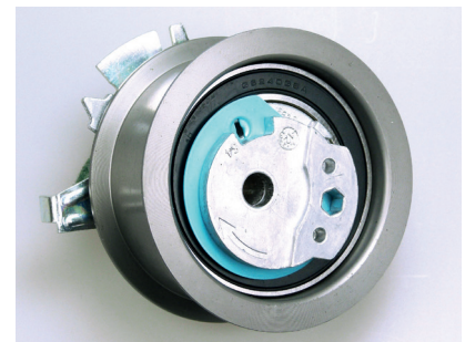
Abb. 1 Rollenausführung bisher

Die gelieferte Spannrolle V56340 unterscheidet sich optisch von der im Fahrzeug verbauten Rolle und lässt sich vermeintlich nicht richtig spannen.